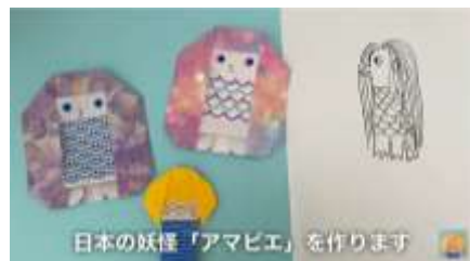
日本の妖怪「アマビエ」を作ります